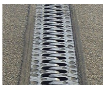
Juntas dentadas en voladizo