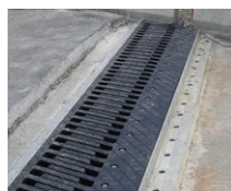
Juntas dentadas deslizantes