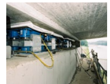
Maas Waalkanaal (NL)