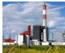
Kraftwerk Theiss (AT)