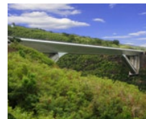
La Réunion (FR)