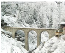
Val da Pila (CH)